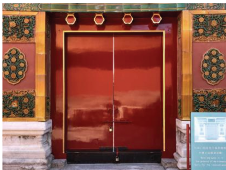
图5 刷完罩面油的古建大门

的光油,位于油饰最外层,可使油面平整光滑、细腻明亮,既保护木构件,又产生极佳的色彩展示效果(见图5)。