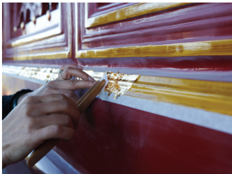
图7 油饰技艺中金箔的使用

金熔化成金锭,对金锭进行反复打箔,将金箔包入乌金纸内等工序。金箔没有成品率,没成型的金箔全部回炉重打。金箔生产工艺独特,技术要求高,从古至今一直为手工制作,需要2个人面对面打上万次 [45] 。经专家计算,1两黄金最多贴24.37m 2 [18] 。