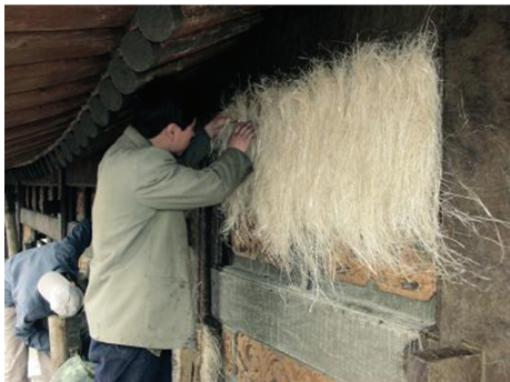
图3 木构件地仗层使麻