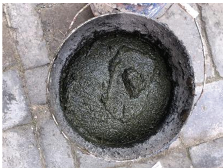
图 2 含有血料的灰浆