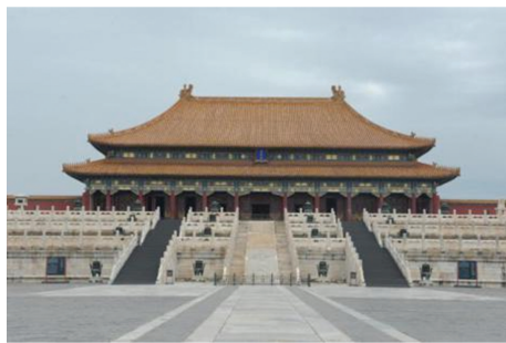
图6 金碧辉煌的太和殿外立面