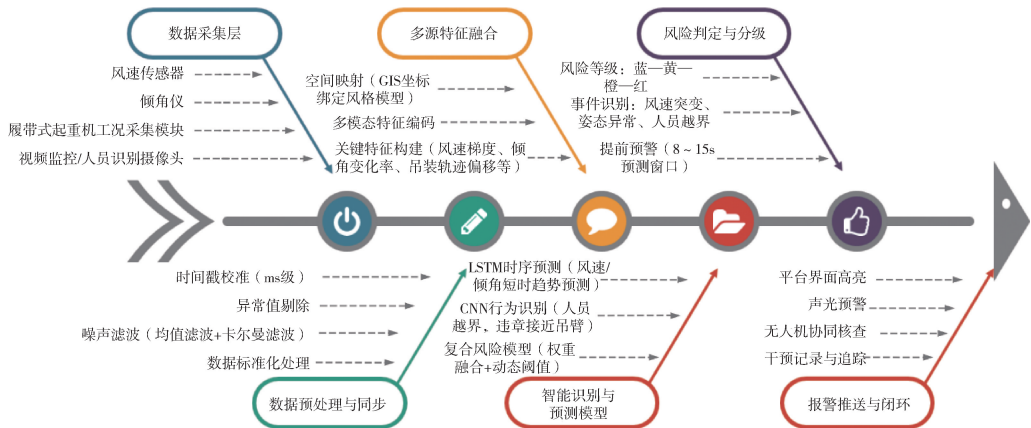
图 3 风机吊装智慧监测系统算法流程